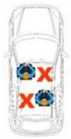
Samochód 4-6 osobowy